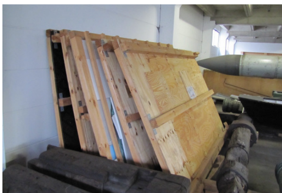
Weitere verpackte Glasflügel