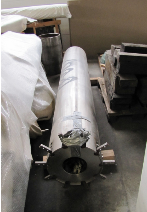
Stahlschaft, wird teleskopartig auf den kleinen Schaft (hinten) gesteckt