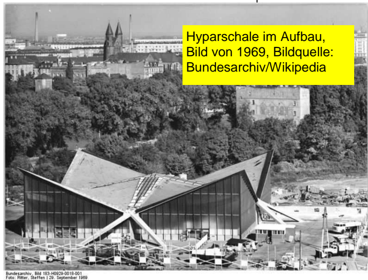
Hyparschale im Aufbau, Bild von 1969

nen zeigten sich ebenso irritiert und vor den Kopf gestoßen. Der OB versuchte zu beschwichtigen, dass es sich nur um eine Ausschreibung handele und der Stadtrat das letzte Wort bei der Entscheidung habe und 2012 sowieso nichts passieren würde. Zufrieden war die Mehrheit der Stadträte mit dieser Antwort nicht.